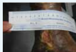
Abb. 1: Ulcus cruris bei Behandlungsbeginn