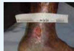
Abb. 2: Ulcus cruris nach einer zweiwöchigen Behandlung mit einem Protease-modulierenden Verband